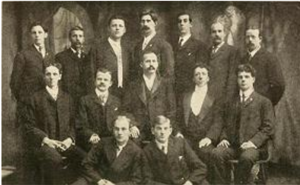
Primera Promoción de Graduados en Naturopatía en la American School of Naturopathy de New York (1902)