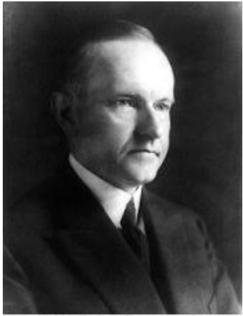
John Calvin Coolidge, presidente de USA en 1929

La ley que ampara el reconocimiento de Naturopatía, aprobada por Congreso de los Estados Unidos, en febrero de 1929, es una ley clarificadora.