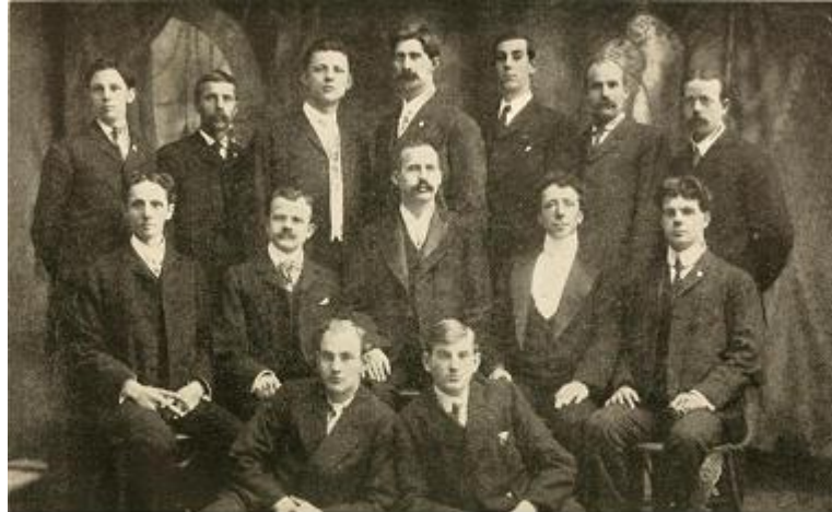
Primera Promoción de Graduados en Naturopatía en la American School of Naturopathy de New York (1902)